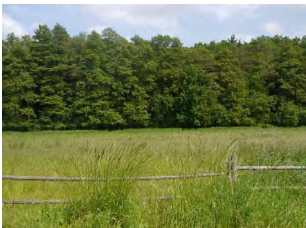
H.11 Dobře udržovaný biokoridor.