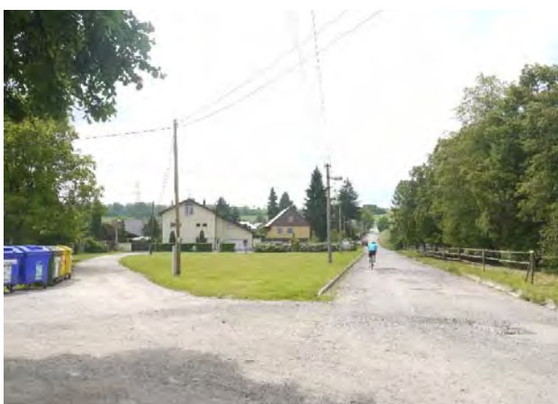
H.06 Malé náměstí je cenným veřejným prostranstvím. Po zastavění lokality Na Vrážce má potenciál stát se centrem západní části města. Současný stav jeho povrchů je ale nevyhovující.