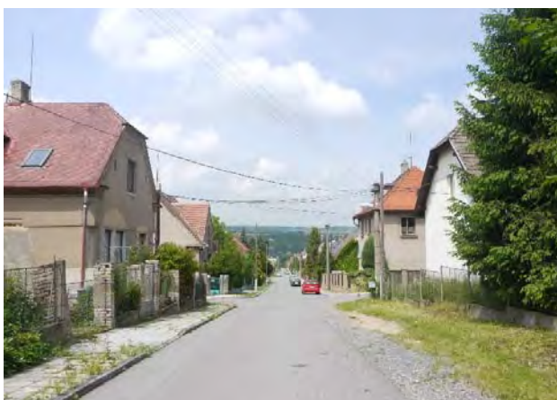
H.05 Prvorepubliková západní vilová čtvrť má poklidný řád. Ulice jsou založeny dostatečně široce (8/10 m), aby se do nich vešla vozovka i oboustranný chodník. Pozemky jsou zhruba stejně široké, domy mají podobný objem a podobné vzájemné odstupy. Jsou umístěny na víceméně jednotné stavební čáře, mají tak příjemnou menší předzahrádku a větší zadní zahradu. Pravoúhlá síť ulic nabízí výhledy do přírodního okolí.