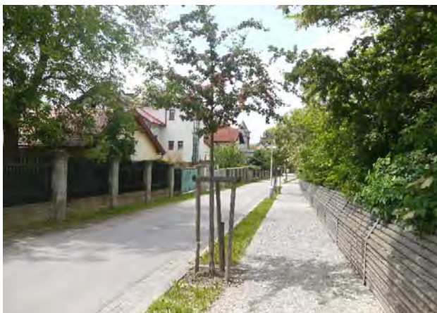
H.04 Nábřežní promenáda s nově vysázeným stromořadím.