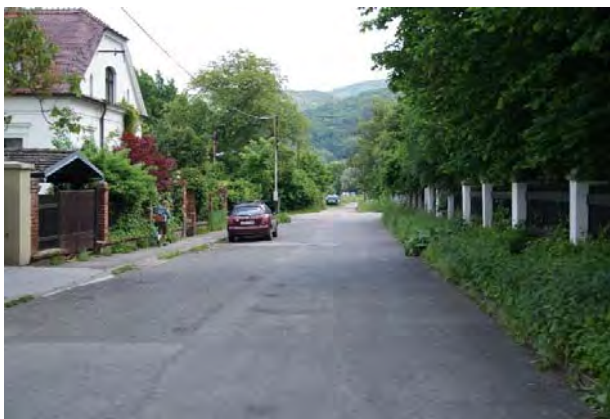
H.07 Průhledy ulic do zalesněných strání Hřebenů.