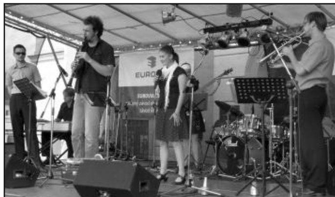
Mezi posluchači vyvolala velký ohlas kapela Pilsner Jazz Band (na snímku).